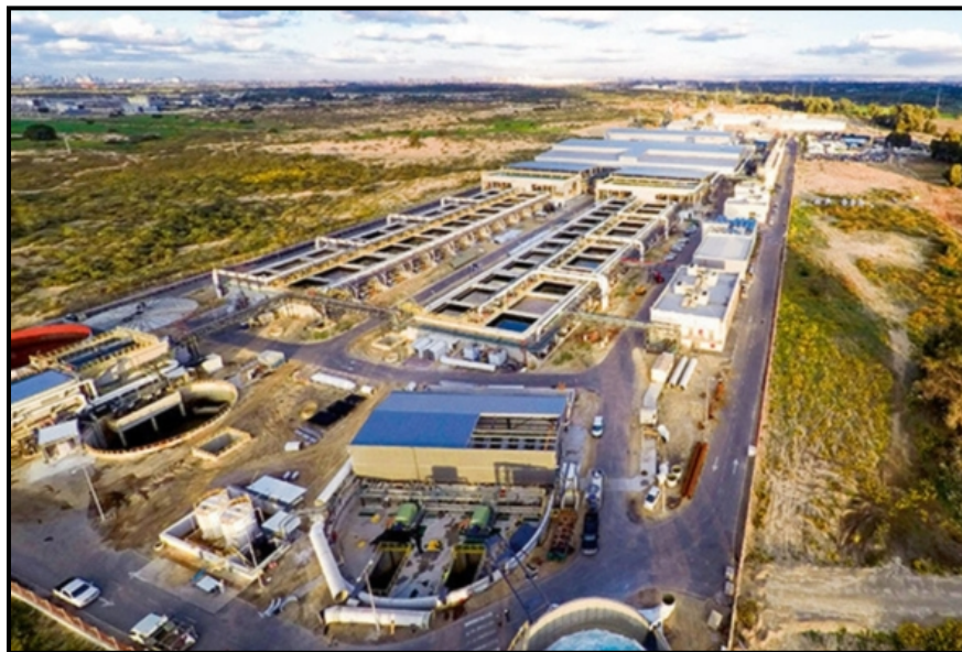
Figura 1. Planta desalinizadora Zorek