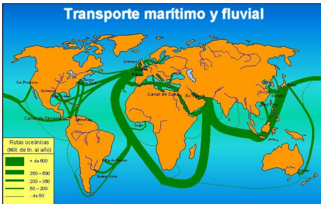
Figura 1: Principales rutas marítimas para el comercio y transporte

La Isla de Cuba sigue siendo un centro donde confluyen un 60% de las rutas que surcan en aguas del océano atlántico entre Europa y America. Fuente: http://laotraopinion.net/desarrollo-de-infraestructura/puertos-maritimos-en-el-desarrollo-del-transporte/principales-rutas-comercio-maritimo-mundial/ .