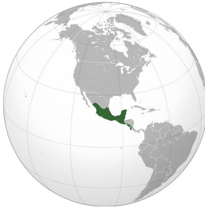
Imagen 2.- Mapa de Mesoamérica.

En la frontera sur de México se han producido cruces e intercambios permanentes propiciados por un origen multicultural común de diferentes pueblos indígenas y mestizos, el territorio llamado históricamente Mesoamérica. Esta región cultural comprende la mitad meridional de México, los territorios de Guatemala , El Salvador y Belice , así como el occidente de Honduras , Nicaragua y Costa Rica , como se aprecia en la imagen. Este espacio, que significa “América media”, se diferencia de otras regiones por la forma de vida de sus pobladores, su clima y su geografía.