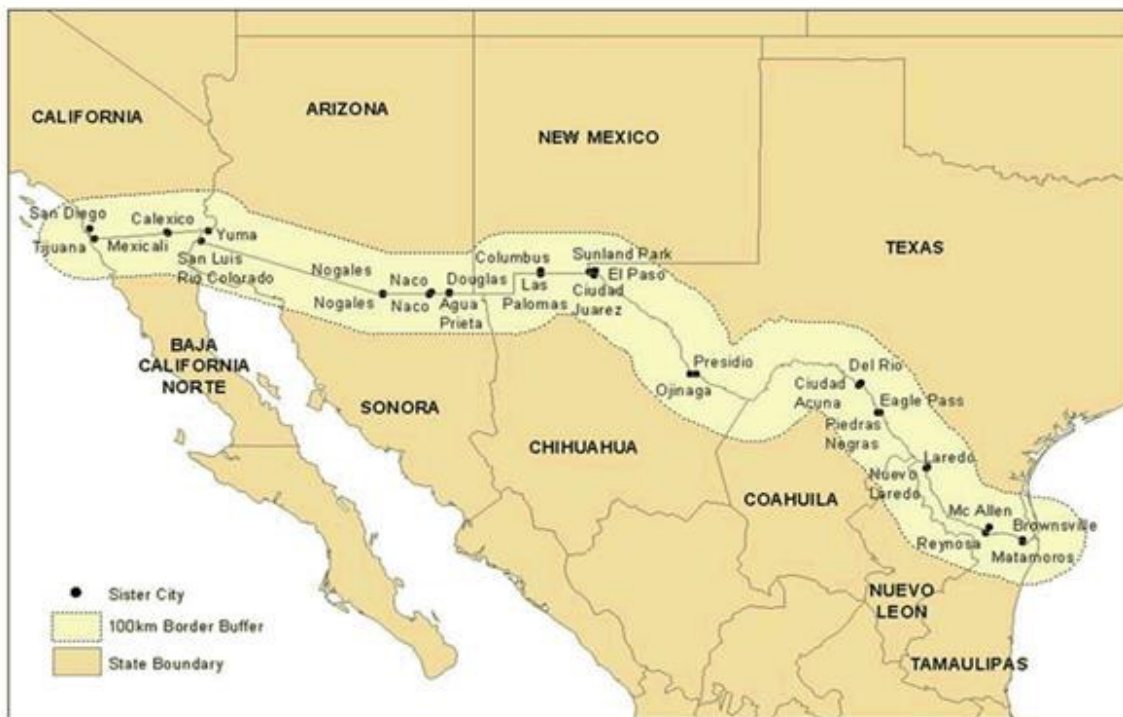
Imagen 1.- Ciudades Fronterizas.

Para México, el principal objetivo de su política exterior siempre ha sido contener la hegemonía estadounidense. A partir de los años 1930 y una vez consolidado el régimen político emanado de la revolución de 1910 –centrado en la dominación política de un partido oficial casi único –el Partido Revolucionario Institucional (PRI)–, México se centró en maximizar su autonomía para gobernar el país sin intervenciones ni injerencias externas, en particular de su vecino del Norte. Por parte de EE.UU, la prioridad de su política exterior hacia su vecino del Sur se centró en garantizar la estabilidad económica, política y social y como resultado de ello la seguridad de su frontera, prioridad que se ha mantenido constante hasta la fecha 7 .