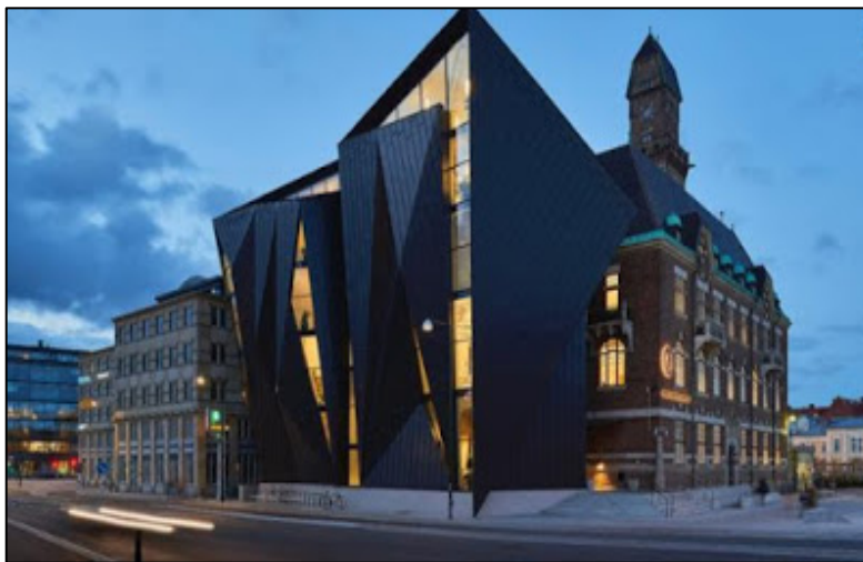
Figura 3. Edificio actual de la WMU (Malmö, Suecia).

El 19 de mayo de 2015, se inauguraron las nuevas instalaciones de la universidad en la misma ciudad de Malmö, además de esta celebración, el evento concentró una serie de oradores e invitados de todas partes del mundo (WMU, 2015). Actualmente la Universidad se ubica en el emblemático edificio Old Harbour Master's Building con una extensión elaborada por el arquitecto danés Kim Utzon y la firma australiana Terroir Architects (figura 3).