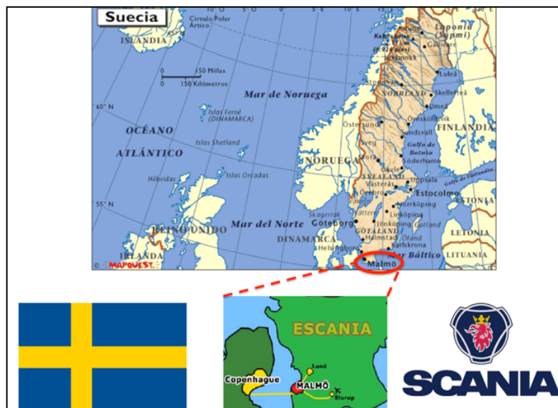
Figura 2. Ubicación de Malmö, Suecia.