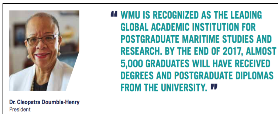
Figura 4. Actual Presidente de la WMU

La WMU es reconocida como la institución académica líder global por sus estudios marítimos de posgrado y de investigación. Para finales de 2017, casi 5 mil graduados habrán recibido diplomas de grado y posgrado de la Universidad (traducción del autor) Fuente: (WMU, 2018, pág. 2).