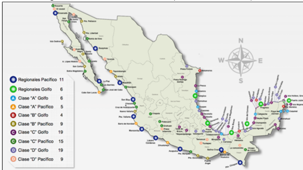
Figura 4. Distribución actual de las Capitanías de Puerto del país.