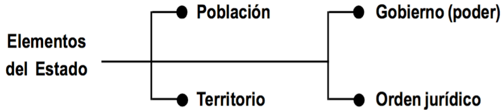
Figura 2. Elementos del Estado.

En otras palabras, los elementos del Estado son: población, territorio, gobierno o poder soberano y orden jurídico, tal como se aprecia en la figura 2.