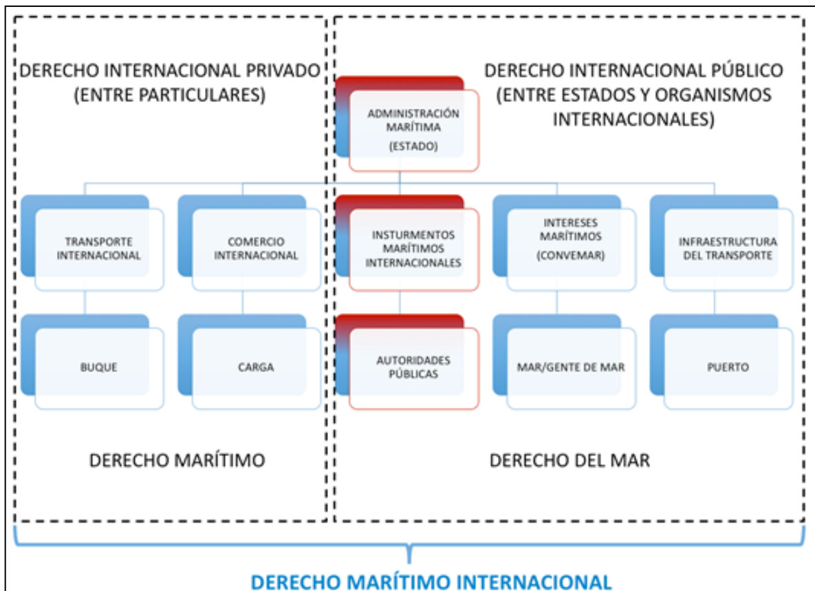
Figura 1. Componentes básicos de la administración marítima.

La figura 1 muestra los componentes básicos de la administración marítima y los ubica como parte del derecho internacional tanto público como privado, dentro del marco del derecho marítimo internacional.