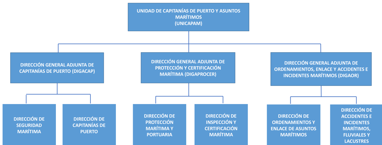
Figura 5. Estructura actual de la UNICAPAM (dependiente del Secretario de Marina).