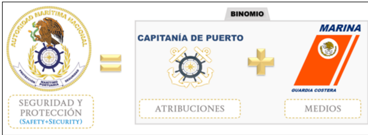
Figura 6. El binomio de la Autoridad Marítima Nacional.

De esta manera, como lo establece el artículo 7 de la LNCM y se muestra en la tabla 3: “La Autoridad Marítima Nacional la ejerce el Ejecutivo Federal a través de la SEMAR para el ejercicio de la soberanía, la protección y la seguridad marítima, así como el mantenimiento del estado de derecho en las zonas marinas mexicanas...”