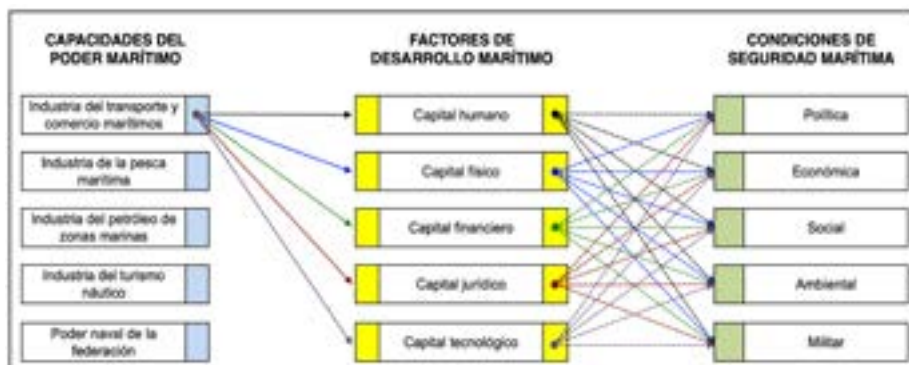
Figura 2. Interrelación entre categorías y subcategorías de análisis

Estas categorías y subcategorías del Desarrollo Marítimo mexicano se interrelacionan entre sí, conformando una red estructural y funcional que afecta o impacta de manera directa o indirecta en el desarrollo de alguna capacidad o intereses del Estado mexicano en el ámbito marítimo. En la figura 2 se muestra la interacción de la subcategoría «Industria del transporte y comercio marítimo» con los factores de Desarrollo Marítimo y las condiciones de Seguridad Marítima. Hay que considerar que, cada una de las capacidades, recursos o intereses que se pretenden desarrollar, presentan la misma dinámica con las otras subcategorías.