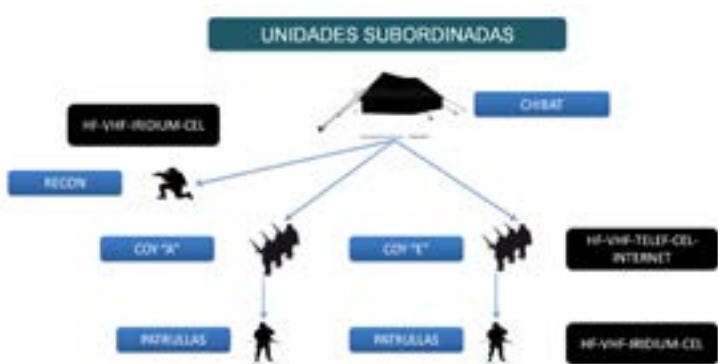
Figura 2.- Unidades subordinadas.

lidad correspondiente, como se observa en la figura 2.