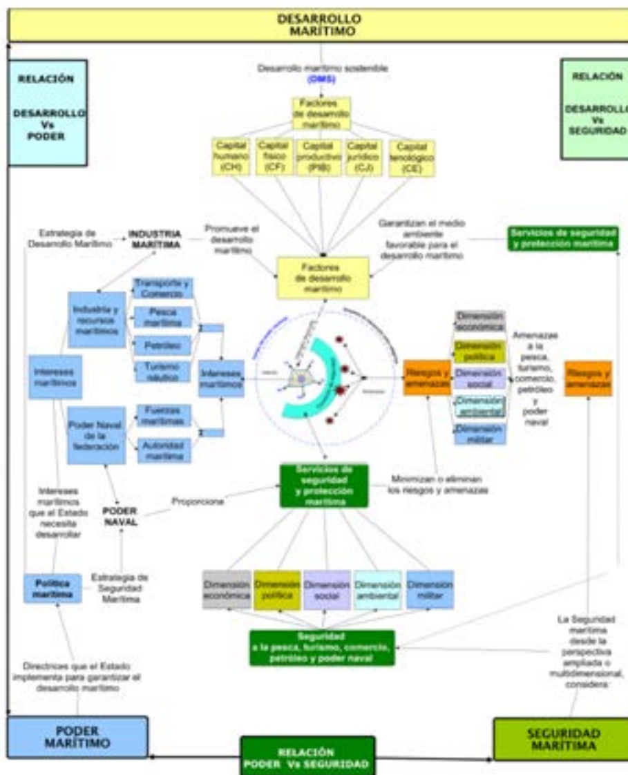
Figura 3: Modelo de Desarrollo Marítimo