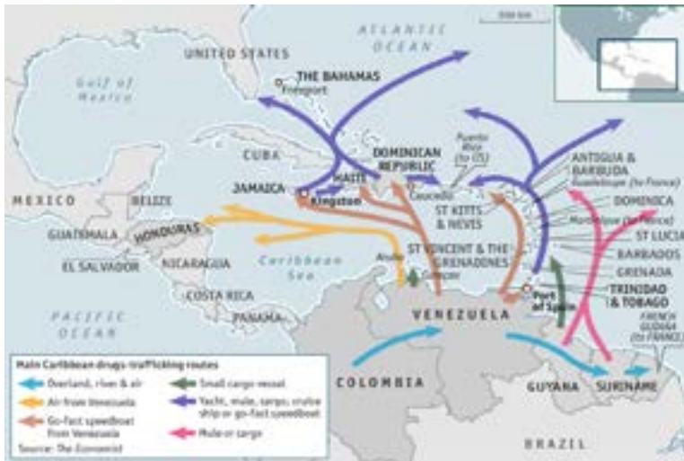
Figura 1. Mapa tráfico de drogas en el Caribe