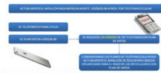
Figura 3.- Descripción de la telefonía celular del Batallón Chile.

En la figura 3, se muestra una descripción general de la telefonía celular del batallón de Chile. Cabe hacer mención, que la mayor cantidad de enlaces es por medio de la red celular, debido a que las comunicaciones a nivel contingente son de poca confiabilidad, por lo que es un factor a considerar para el despliegue de cualquier misión de paz.