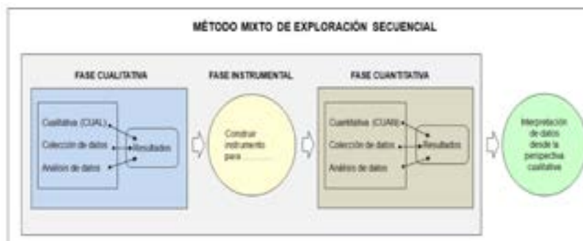
Figura 1: Fases del Método Mixto Exploratorio Secuencial