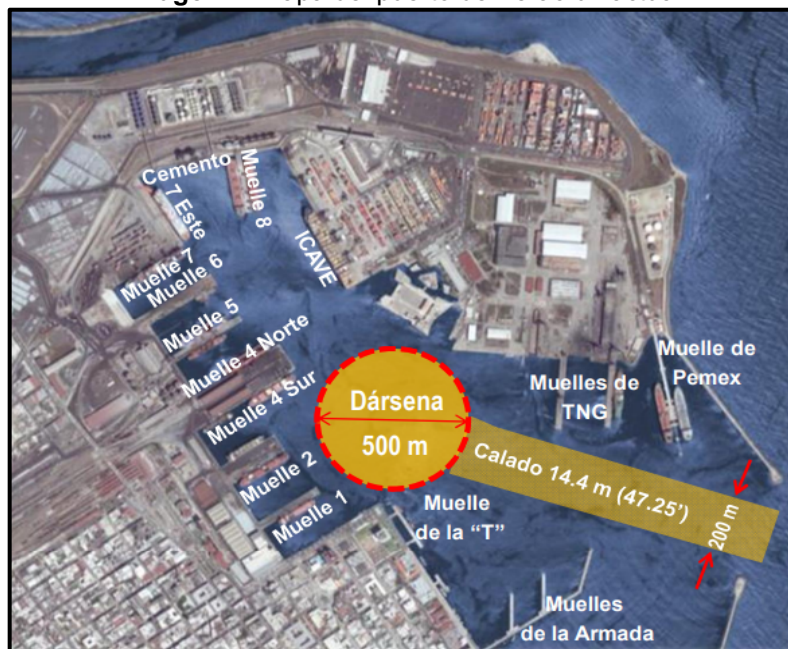
Imagen 1: Mapa del puerto de Veracruz actual

Frente de atraque (Dársena de operación): Actualmente, el puerto de Veracruz cuenta con un total de 604 hectáreas (237 de agua y 367 de tierra), con 22 posiciones de atraque y un calado final de 12 a 14 metros; su capacidad teórica de movimiento de carga es de 23 millones de tons (SCT, 2015). Las áreas para operaciones portuarias del puerto de Veracruz se componen principalmente de los muelles 1, 2, 4, 5, 6, 7, 8, Muelle de Cementos, Muelle de Contenedores (ICAVE), Muelle de la T, Muelle de PEMEX y Muelle del Astillero (TNG), áreas de patios, entre vías y almacenes. (Ver imagen 1).